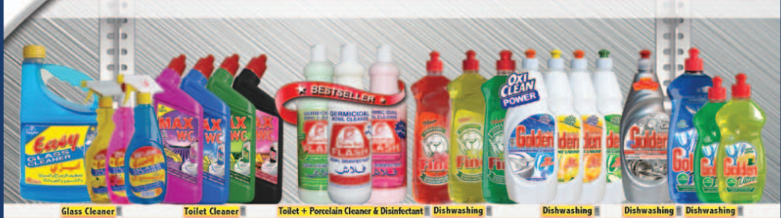
Glass Cleaner | Toilet Cleaner | Toilet + Porcelain Cleaner & Disinfectant | Dishwashing | Dishwashing | Dishwashing | Dishwashing