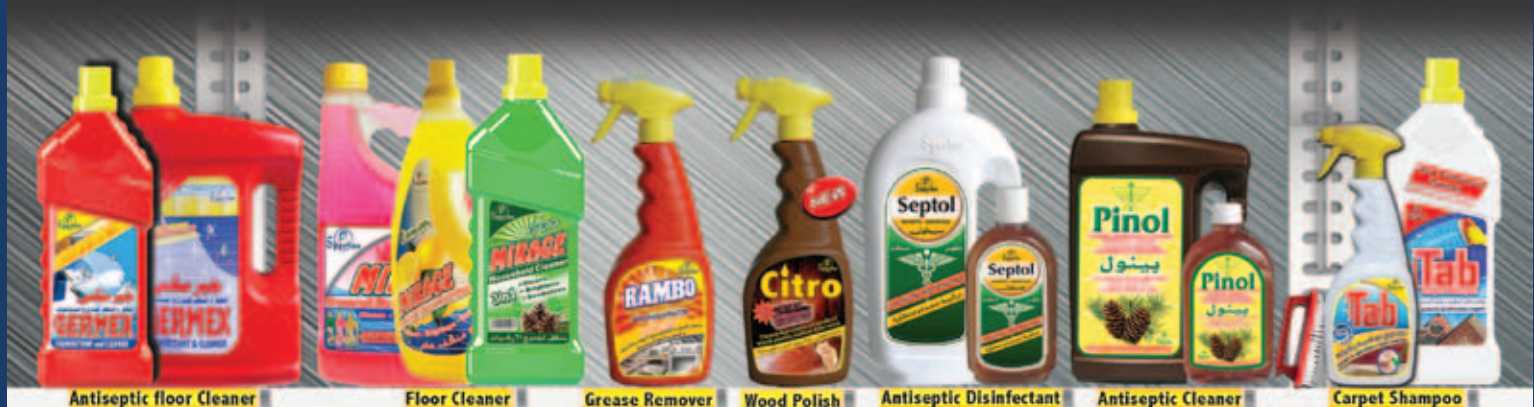
Antiseptic floor Cleaner | Floor Cleaner | Grease Remover | Wood Polish | Antiseptic Disinfectant | Antiseptic Cleaner | Carpet Shampoo