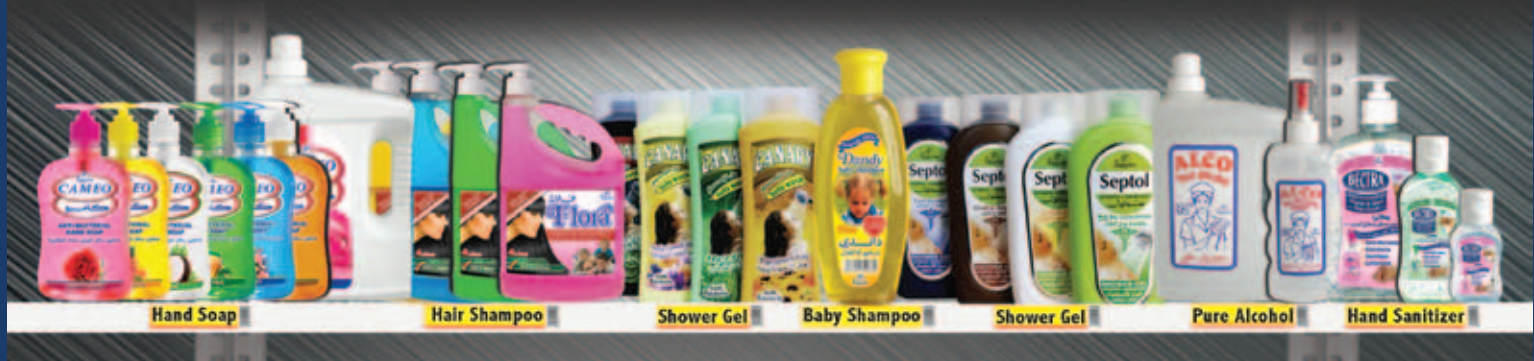
Hand Soap | Hair Shampoo | Shower Gel | Baby Shampoo | Shower Gel | Pure Alcohol | Hand Sanitizer