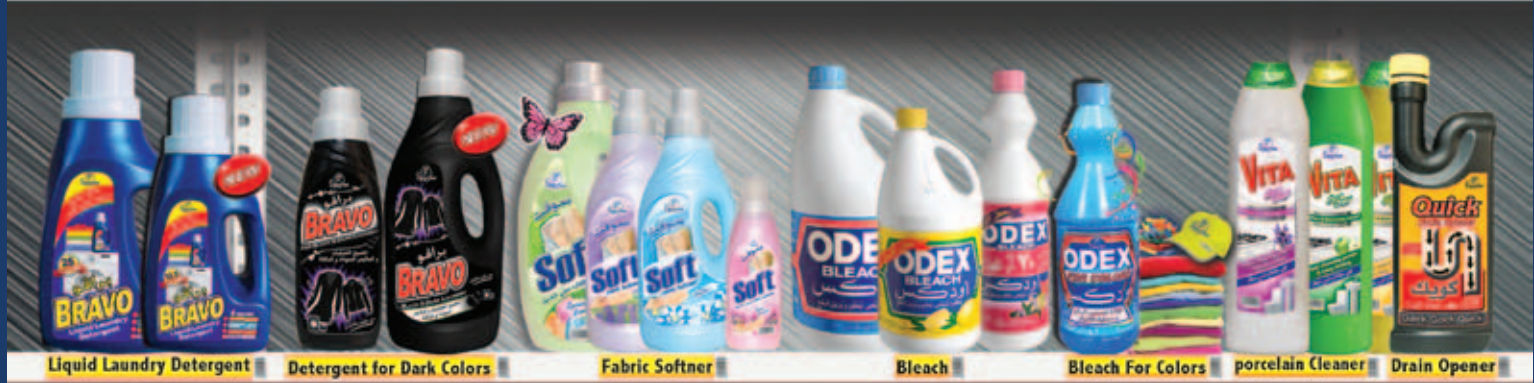
Liquid Laundry Detergent | Detergent for Dark Colors | Fabric Softener | Bleach | Bleach For Colors | porcelain Cleaner | Drain Opener